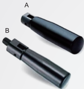
No. : A (內牙型)